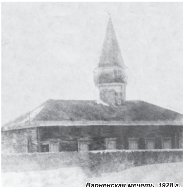
Варненская мечеть. 1928 г.